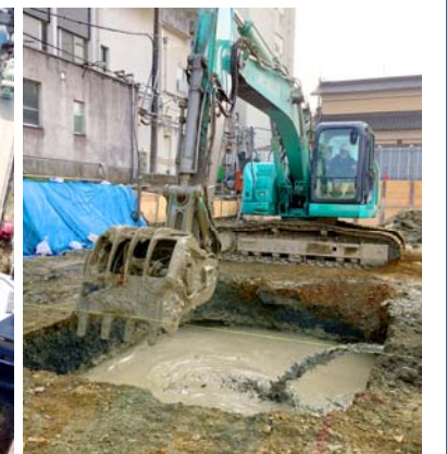
▲地盤改良工事の様子