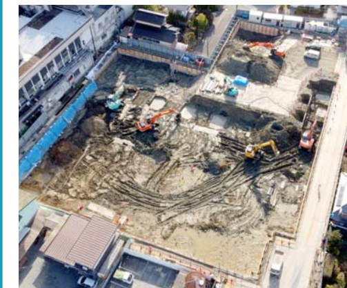
▲上空からのドローン撮影

令和2年10月の着工から3カ月。現在、北棟の地盤改良工事を行っています。3月初旬から基礎工事が始まり、令和4年9月頃には北棟での一部診療開始を予定しています。