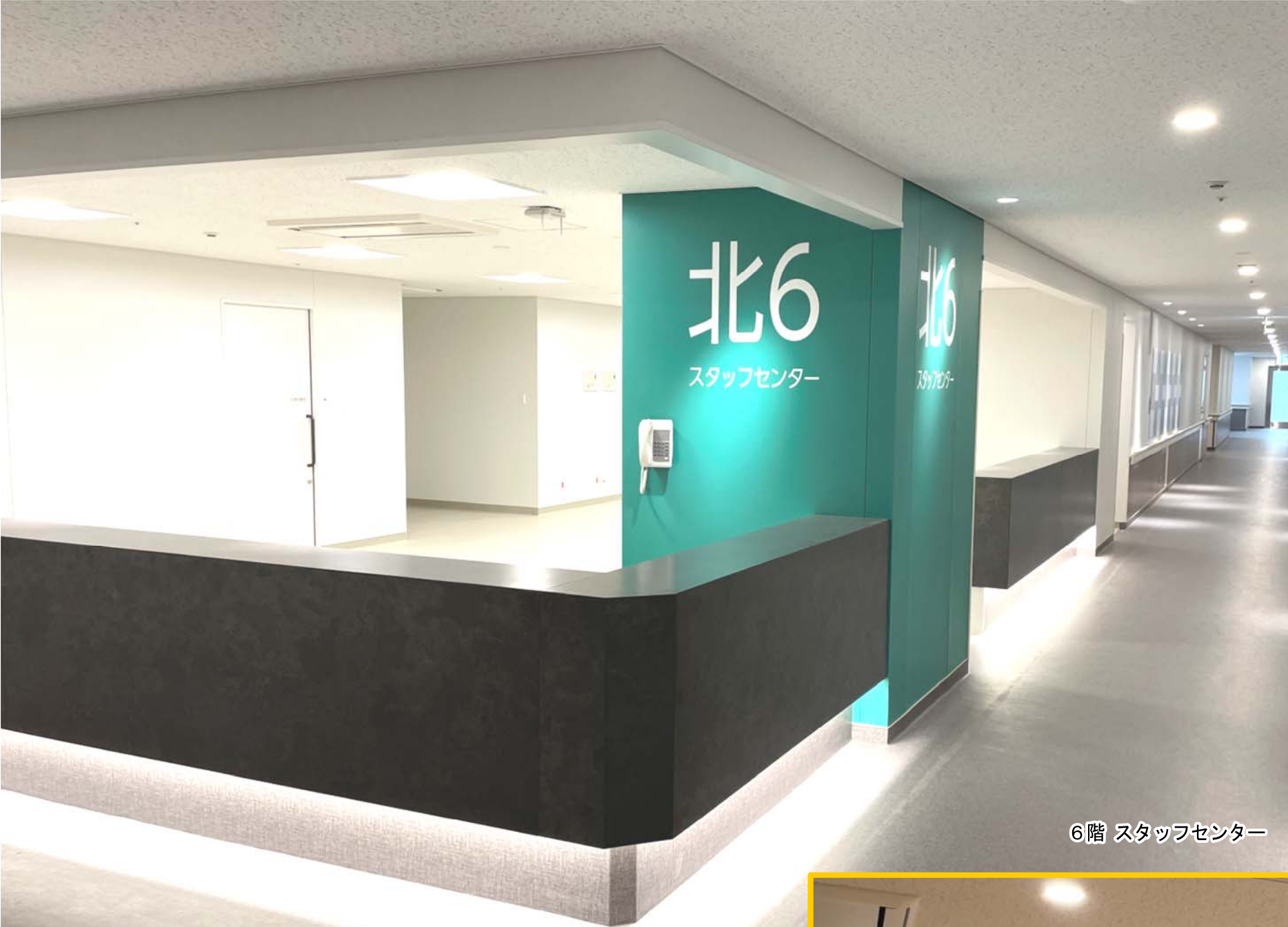
6階 スタッフセンター